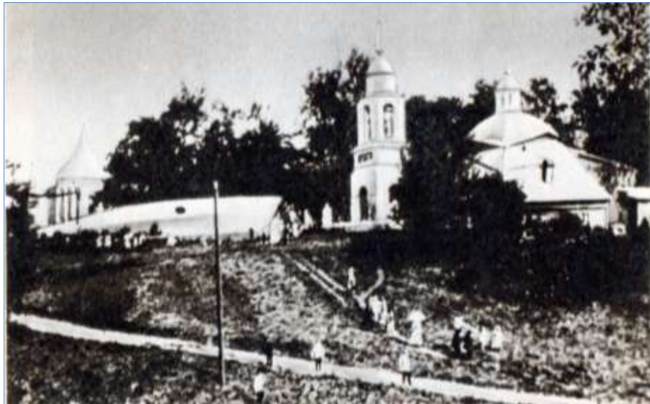
Общий вид на усадьбу Козмодемьянское от реки. Церковь Козьмы и Доминана в Козмодемьянском