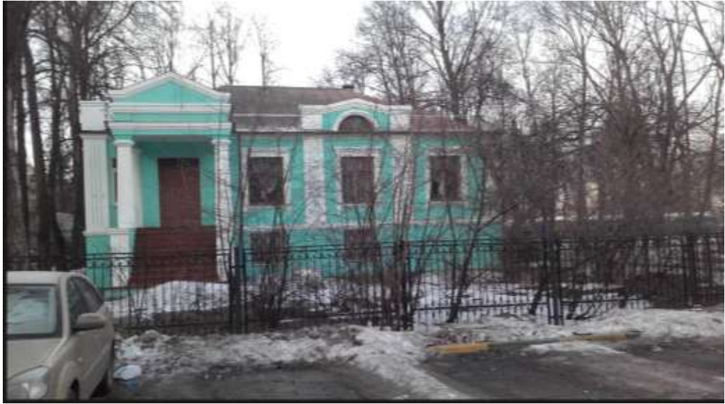
Дачный особняк XIX века, в котором проживал лётчик русский лётчик-истребитель, лётчик-испытатель, Герой Советского Союза, полковник Иван Евграфович Фёдоров.