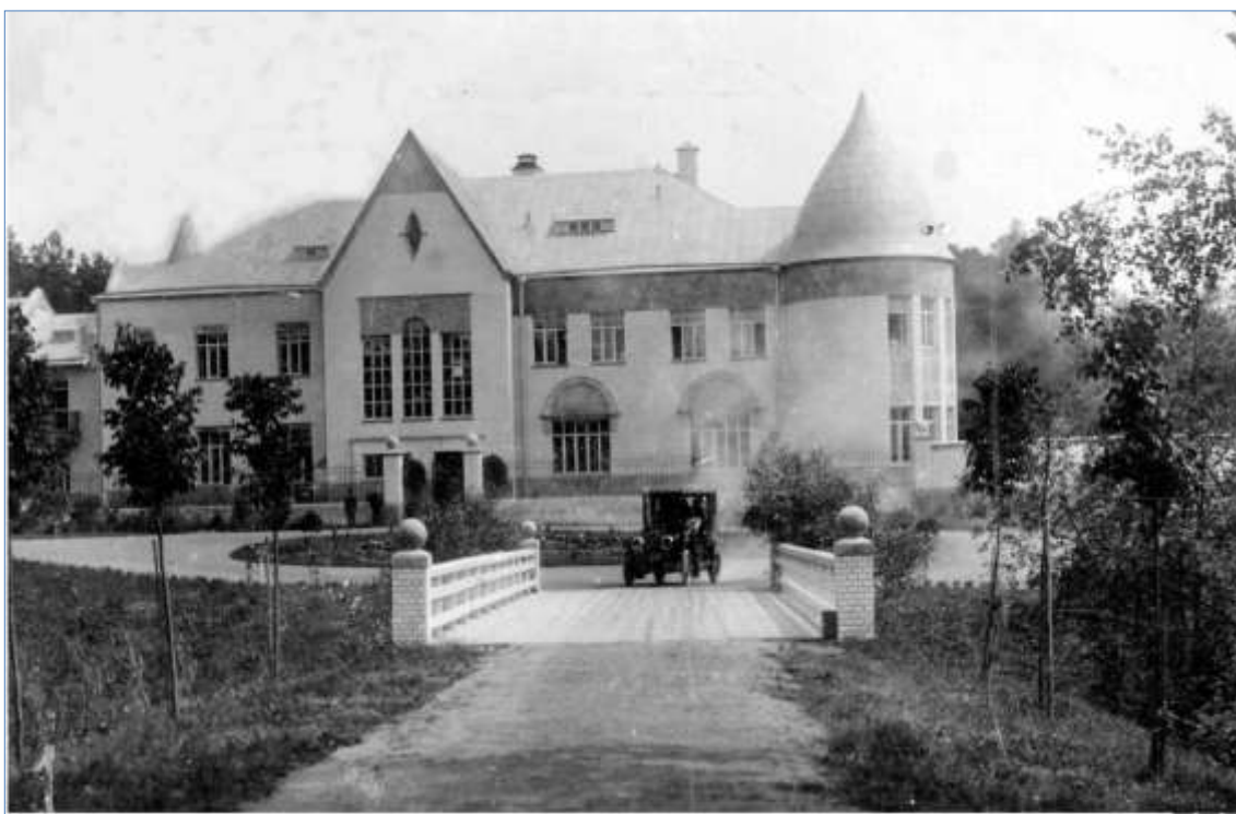
Особняк Патрикеева в Космодемьянском (1909-1019). Архитектор Шехтель. (территория города Москвы)

Полустанок Ховрино в начале XX века вырос в сортировочную станцию. В 1910 году был создан Ховринский железнодорожный узел. И все-таки, несмотря на развитие промышленности, появление фабрик и заводов, территория которую в настоящее время занимает городской округ Химки на рубеже XX века оставалась по большому счету крестьянской и дачной волостью.