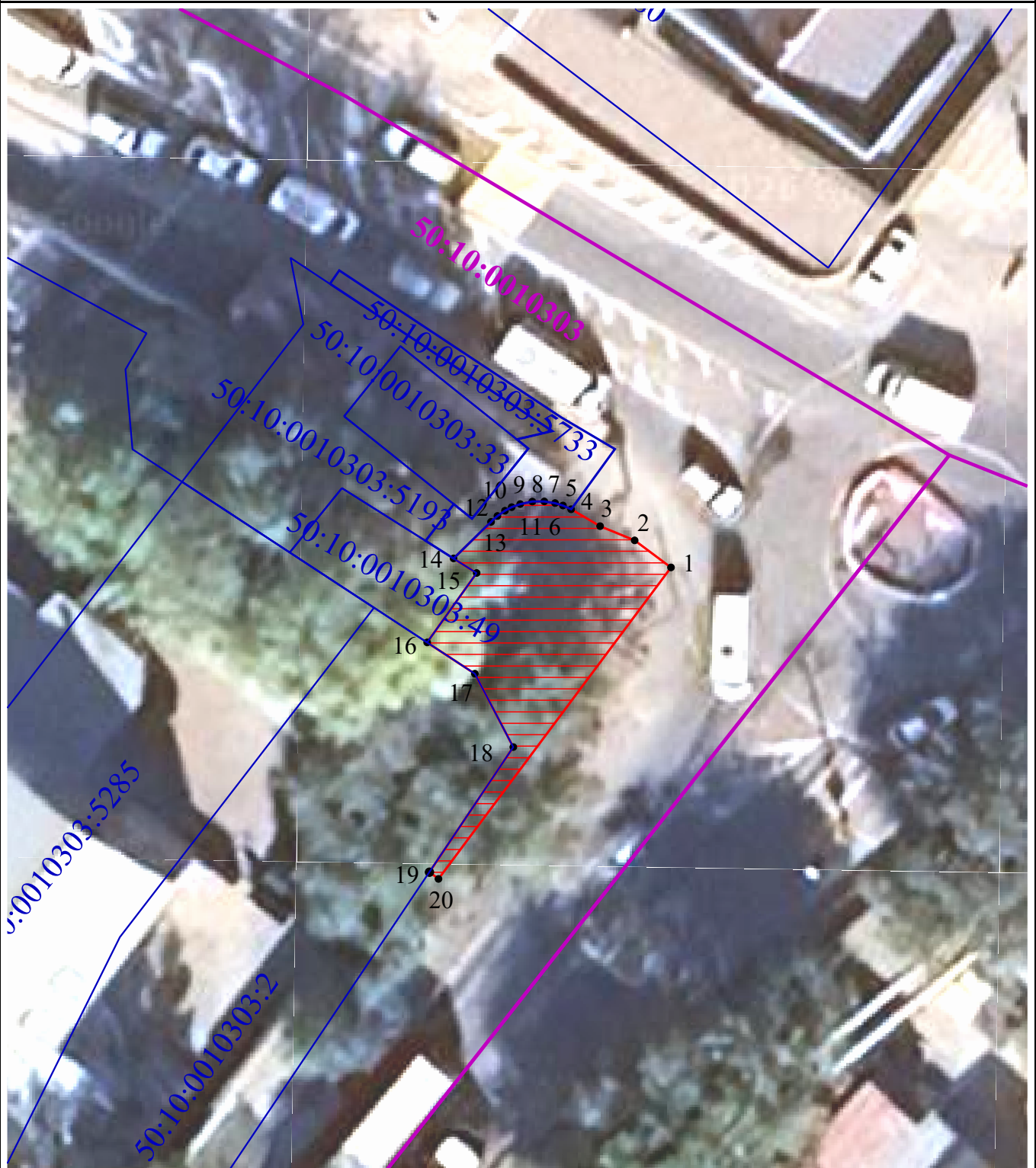
Схема расположения границ публичного сервитута в целях обеспечения строительства, реконструкции объектов инфраструктуры при реализации объекта: «Строительство дополнительных V и VI путей на участке Москва – Алабушево под специализированное пассажи́рское сообщение» («Этап 5. Реконструкция ст. Химки со строительством дополнительных V и VI путей под специализированное пассажирское сообщение»)