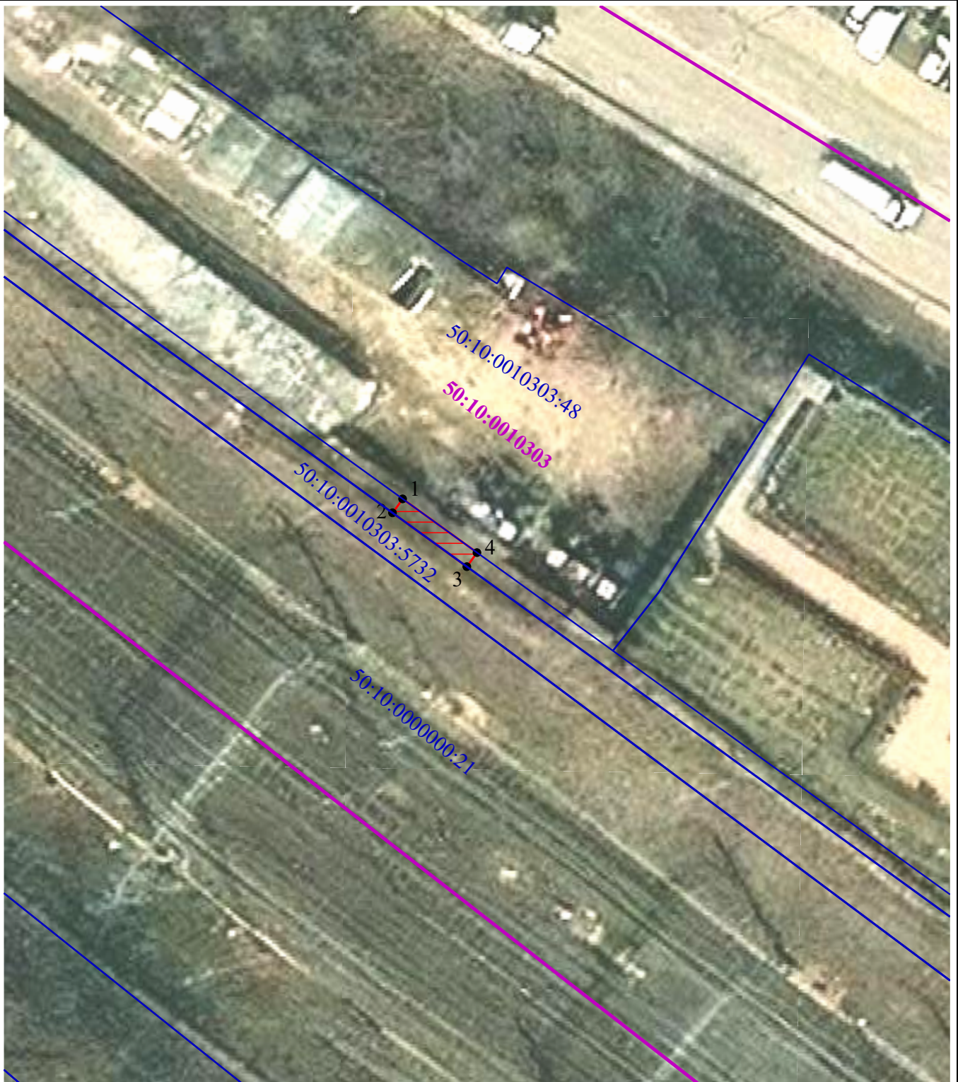
Схема расположения границ публичного сервитута в целях обеспечения строительства, реконструкции объектов инфраструктуры при реализации объекта: «Строительство дополнительных V и VI путей на участке Москва – Алабушево под специализированное пассажирское сообщение» («Этап 5. Реконструкция ст. Химки со строительством дополнительных V и VI путей под специализированное пассажирское сообщение»)