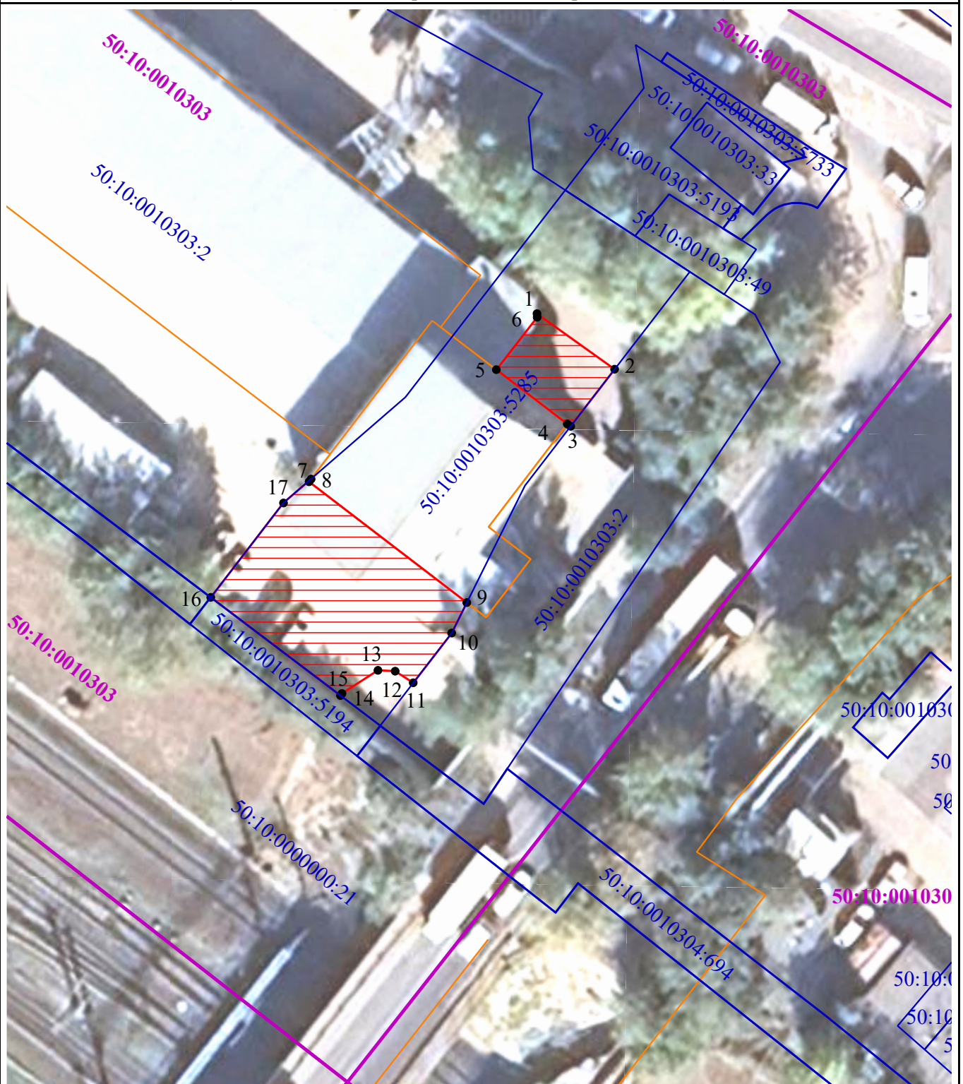
Схема расположения границ публичного сервитута в целях обеспечения строительства, реконструкции объектов инфраструктуры при реализации объекта: «Строительство дополнительных V и VI путей на участке Москва – Алабушево под специализированное пассажи́рское сообщение» («Этап 5. Реконструкция ст. Химки со строительством дополнительных V и VI путей под специализированное пассажирское сообщение»)