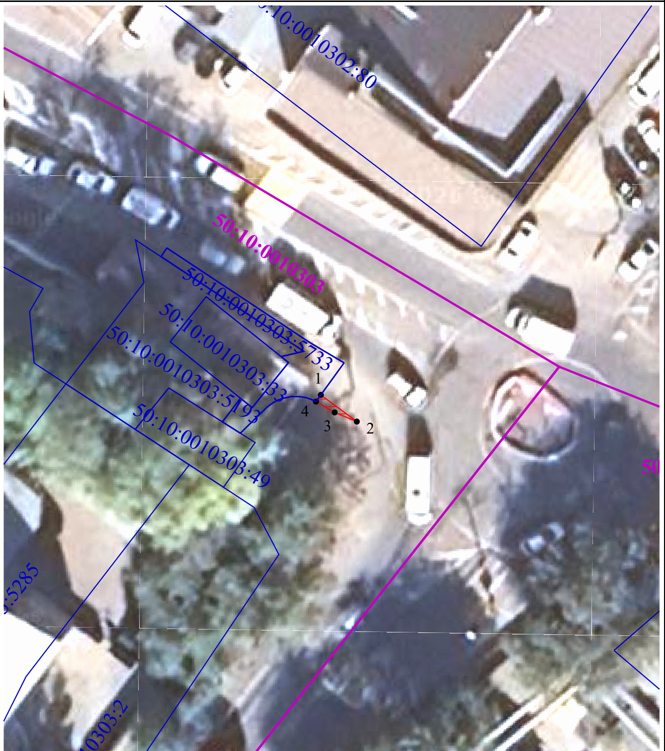
Схема расположения границ публичного сервитута в целях обеспечения строительства, реконструкции объектов инфраструктуры при реализации объекта: «Строительство дополнительных V и VI путей на участке Москва – Алабушево под специализированное пассажирское сообщение» («Этап 5. Реконструкция ст. Химки со строительством дополнительных V и VI путей под специализированное пассажирское сообщение»)