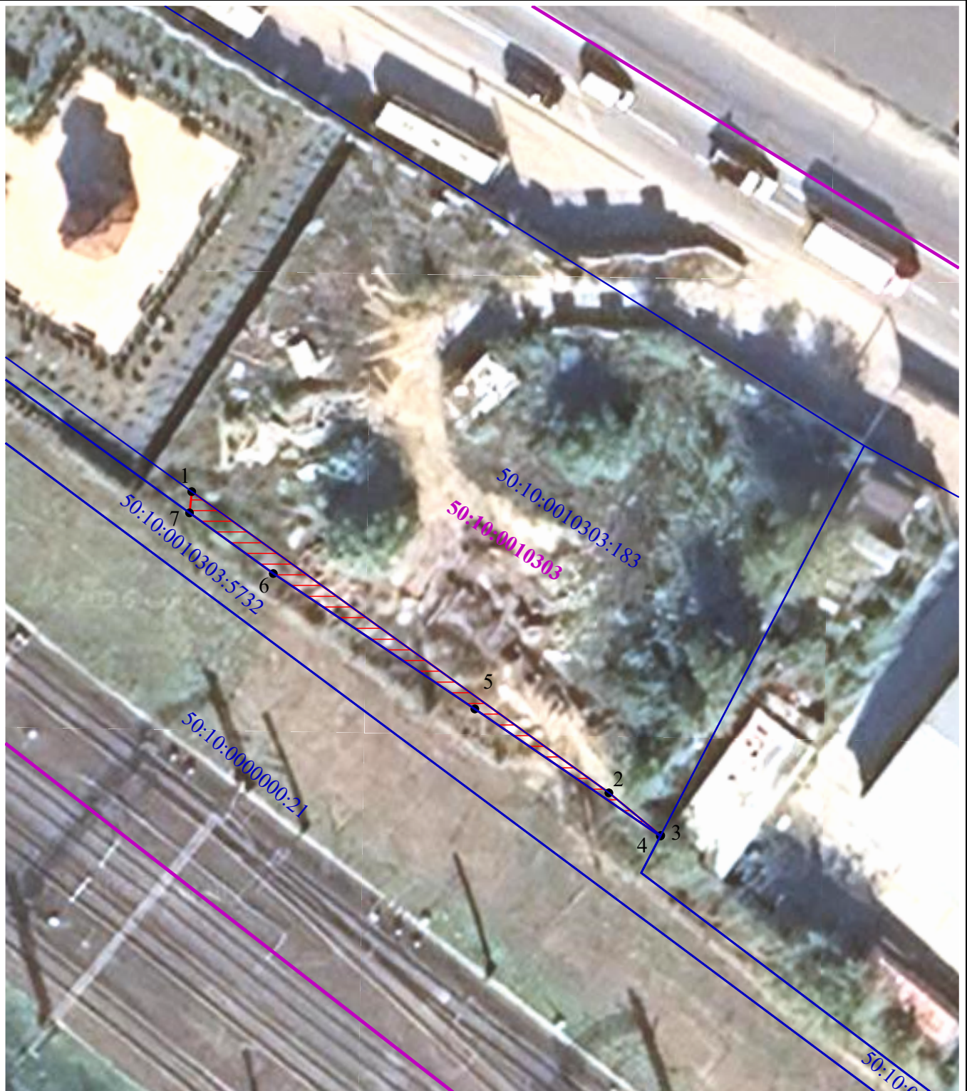
Схема расположения границ публичного сервитута в целях обеспечения строительства, реконструкции объектов инфраструктуры при реализации объекта: «Строительство дополнительных V и VI путей на участке Москва – Алабушево под специализированное пассажи́рское сообщение» («Этап 5. Реконструкция ст. Химки со строительством дополнительных V и VI путей под специализированное пассажирское сообщение»)