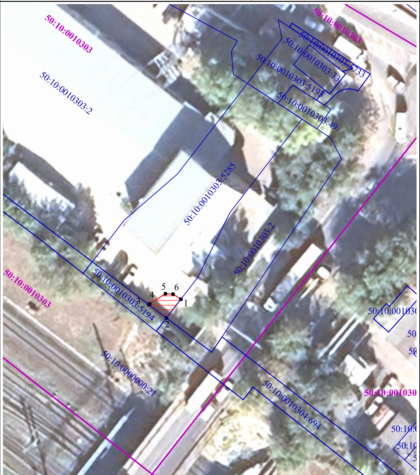
Схема расположения границ публичного сервитута в целях обеспечения строительства, реконструкции объектов инфраструктуры при реализации объекта: «Строительство дополнительных V и VI путей на участке Москва – Алабушево под специализированное пассажи́рское сообщение» («Этап 5. Реконструкция ст. Химки со строительством дополнительных V и VI путей под специализированное пассажирское сообщение»)