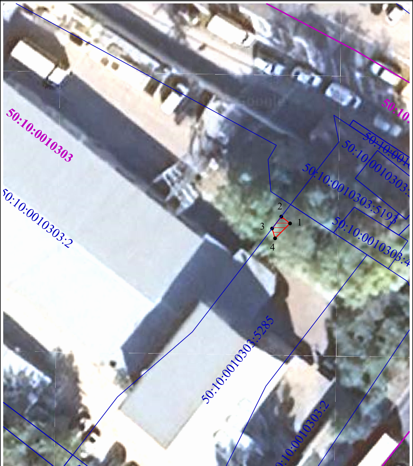
Схема расположения границ публичного сервитута в целях обеспечения строительства, реконструкции объектов инфраструктуры при реализации объекта: «Строительство дополнительных V и VI путей на участке Москва – Алабушево под специализированное пассажи́рское сообщение» («Этап 5. Реконструкция ст. Химки со строительством дополнительных V и VI путей под специализированное пассажирское сообщение»)