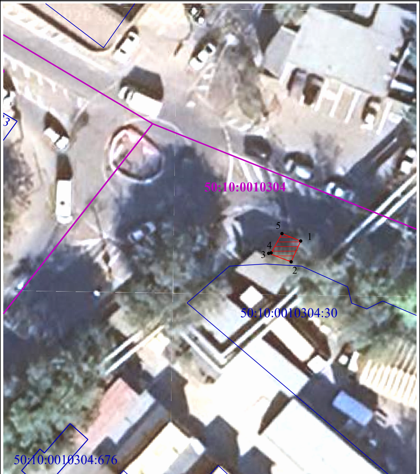
Схема расположения границ публичного сервитута в целях обеспечения строительства, реконструкции объектов инфраструктуры при реализации объекта: «Строительство дополнительных V и VI путей на участке Москва – Алабушево под специализированное пассажирское сообщение» («Этап 5. Реконструкция ст. Химки со строительством дополнительных V и VI путей под специализированное пассажирское сообщение»)