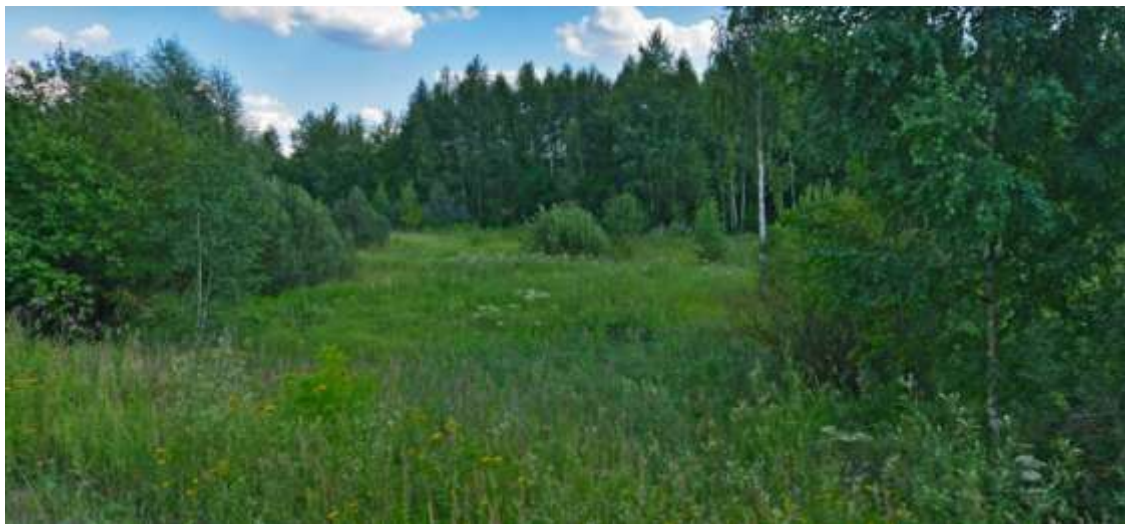
Рисунок 1.1.1. Пойма р. Клязьма в пределах земельного участка с кадастровым номером 50:10:0020903:88

Поймы в пределах данной территории влажные и сырые, с разнотравно-злаковыми лугами на дерново-луговых почвах (рисунок 1.1.1).