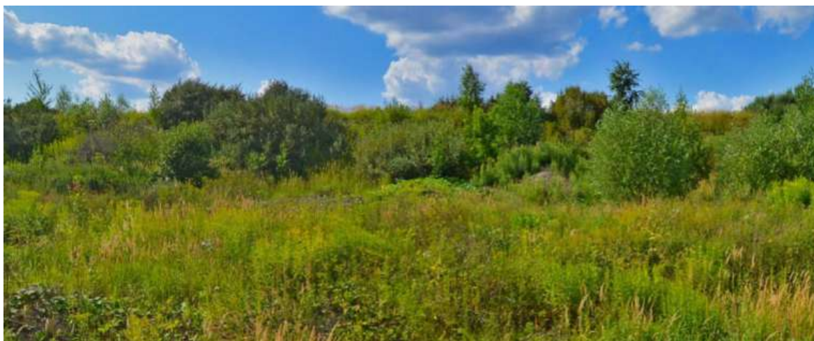
Рисунок 1.1.2. Надпойменные террасы р. Клязьма в пределах земельного участка с кадастровым номером 50:10:0020803:1260

р. Клязьма. Сырые и заболоченные балки, лощины и ложбины покрыты влажнотравно-болотной растительностью.