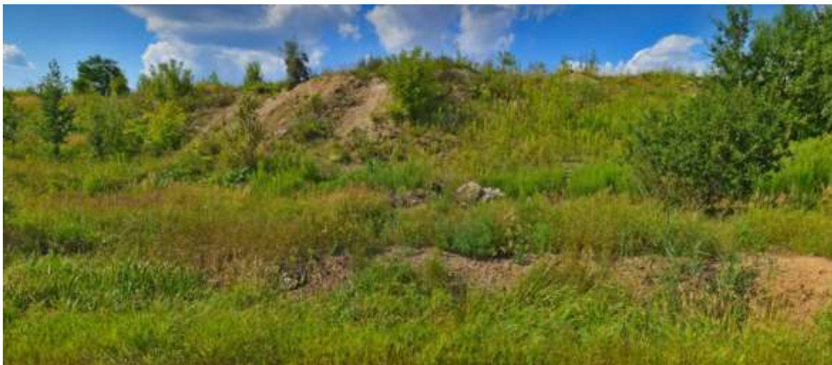
Рисунок 1.4.1. Крутые склоны долины р. Клязьма в пределах земельного участка с кадастровым номером 50:10:0020803:1260

Целесообразно осуществлять регулярный мониторинг за состоянием геологической среды в пределах застроенных территорий.