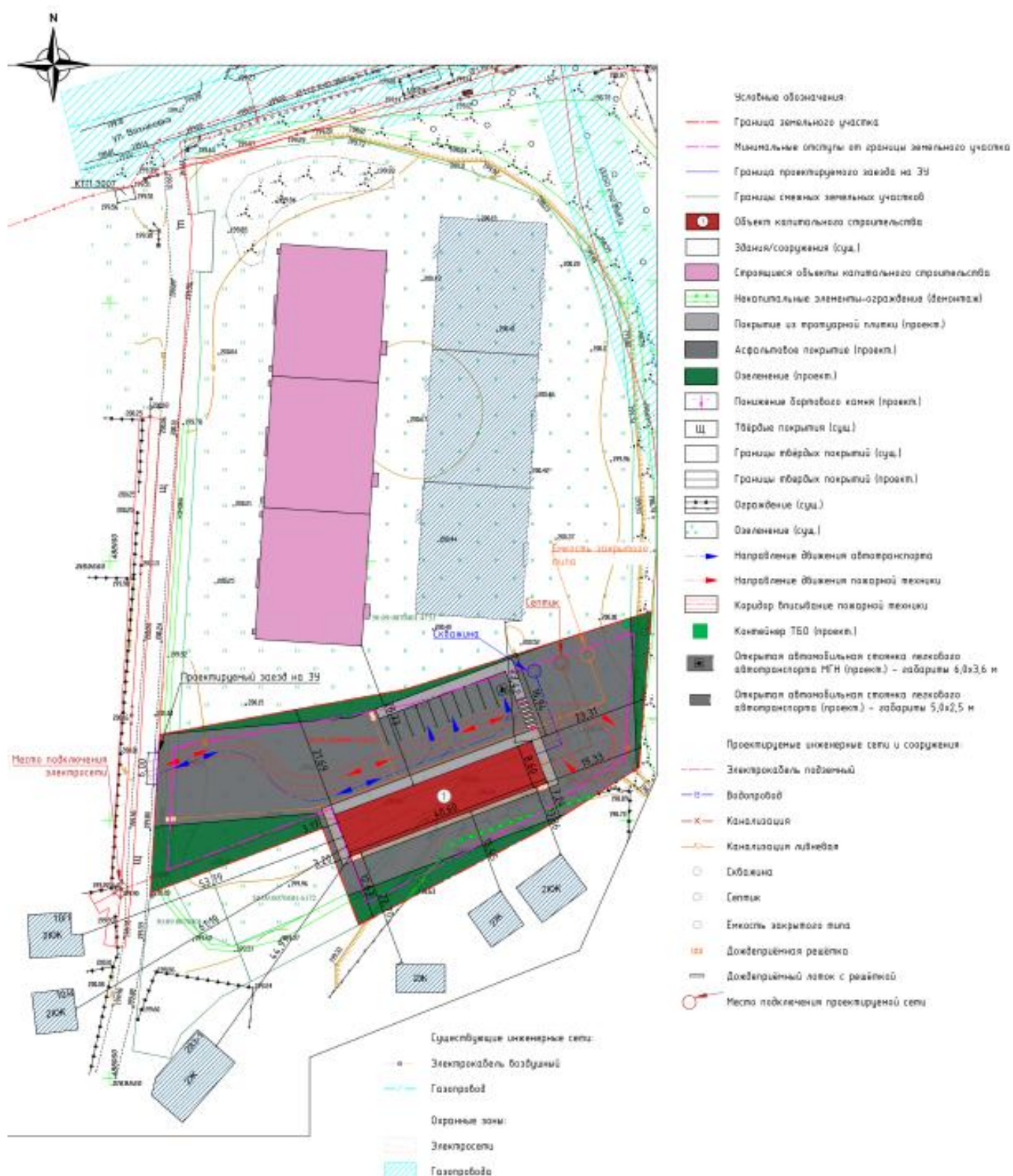
Схема земельного участка с отображением местоположения планируемого объекта капитального строительства, сетей инженерного обеспечения