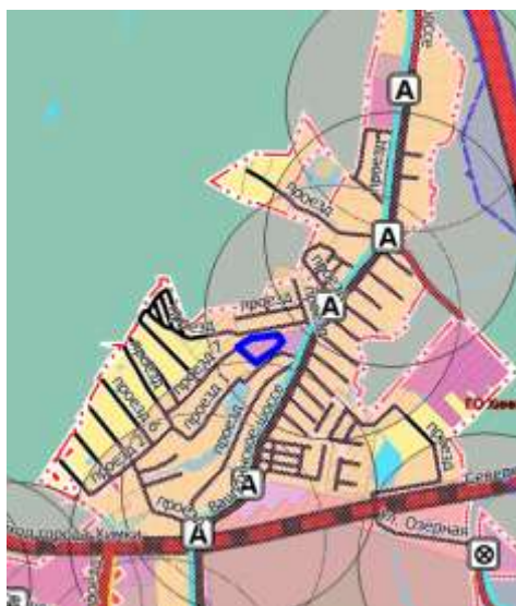
Рис. 3.5.2.5.1.1. Схема сети маршрутов регулярных пассажирских перевозок с радиусами нормативной обеспеченности пешеходного подхода до остановки общественного транспорта 500м.

В соответствии с СП 42.13330.2016. Свод правил. Градостроительство. Планировка и застройка городских и сельских поселений. Актуализированная редакция СНиП 2.07.01-89* п. 11.24 дальность пешеходных подходов до ближайшей остановки общественного пассажирского транспорта допускается принимать не более 500 м, в районах малоэтажной жилой застройки дальность пешеходных подходов к ближайшей остановке общественного транспорта может быть увеличена в больших, крупных и крупнейших городских населенных пунктах до 600 м.