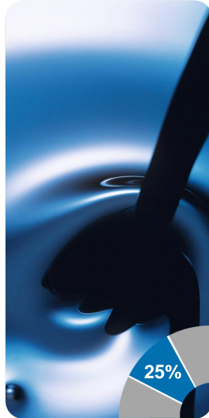
Нефть & Газ