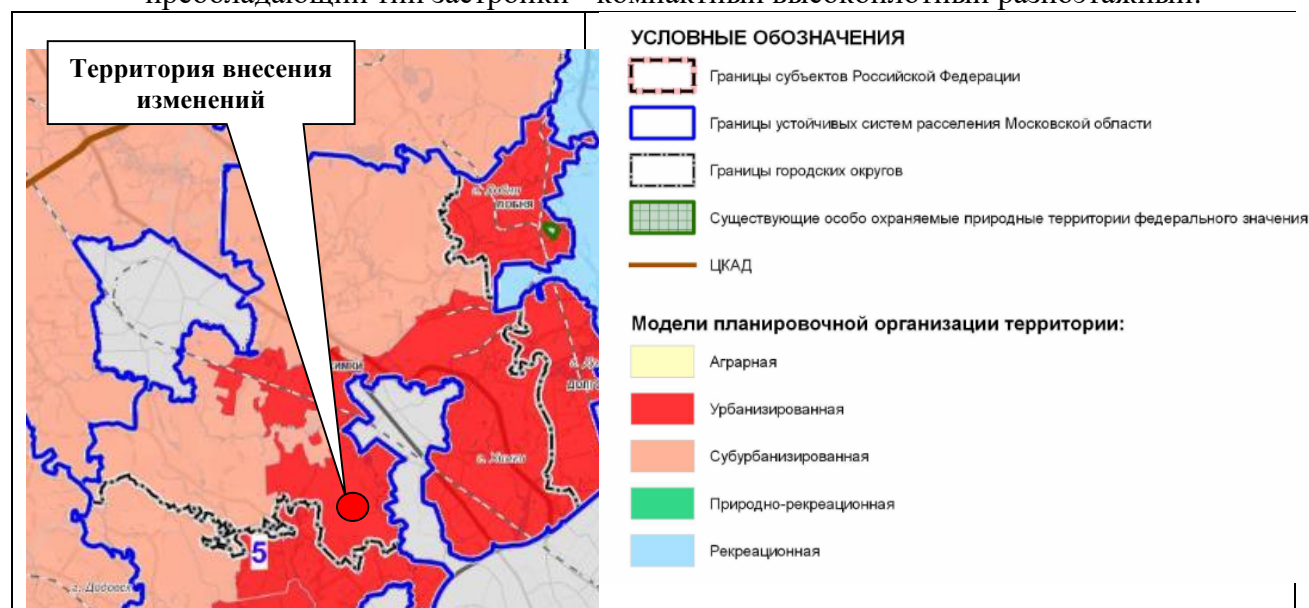
Фрагмент карты устойчивых систем расселения Московской области с указанием местоположения части населённого пункта г. Химки

Для территории внесения изменений выделена урбанизированная модель планировочной организации территории.